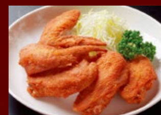
手羽のから揚げ 3本 420円 (税込) 5本 620円 (税込)