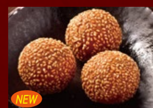
NEW ごまだんご 320円 (税込)