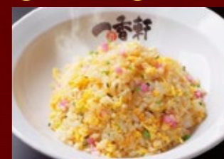
チャーハン 490円 (税込) ミニチャーハン 290円 (税込)