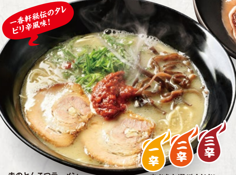
赤のとんこつラーメン