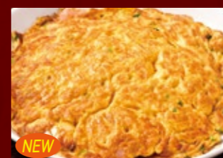
NEW 一香軒特製海老玉 510円 (税込)