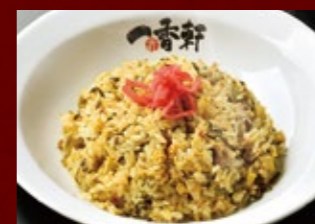
高菜チャーハン 620円 (税込) レタスチャーハン 620円 (税込)