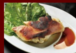
とん足 410円 (税込)