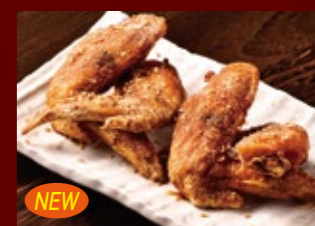
NEW ピリ辛手羽からあげ (名古屋風) 520円 (税込)