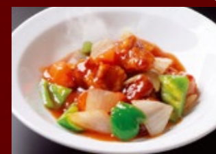
酢ぶた 510円 (税込)