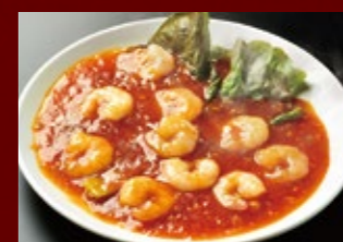
エビチリ 840円 (税込)