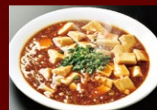
マーボー豆腐 510円 (税込)