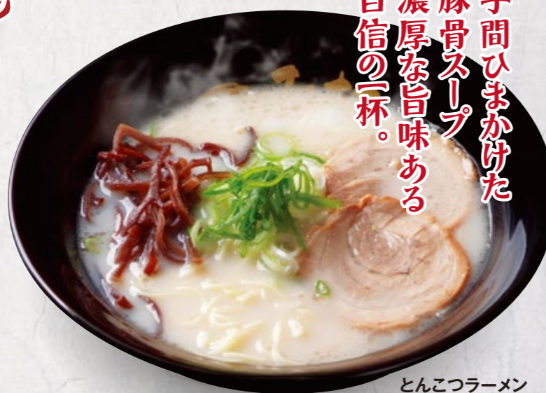
とんこつラーメン