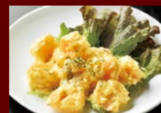
エビマヨ 840円 (税込)