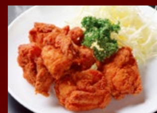
から揚げ 510円 (税込)