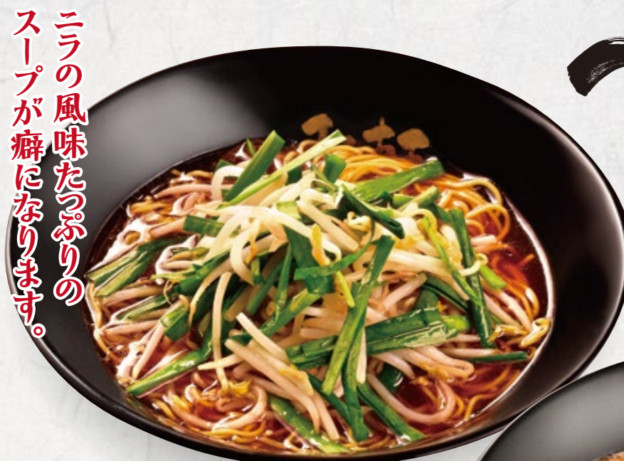
ニラしょうゆラーメン