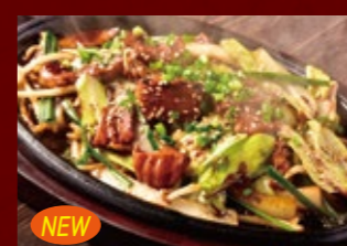
NEW ニラもやしホルモン 970円 (税込)